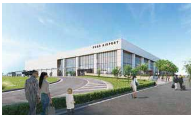
新ターミナル周辺 イメージ図