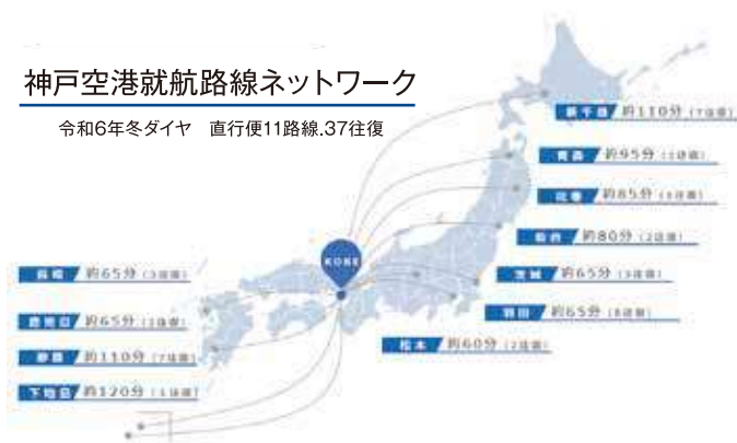
神戸空港就航都市 (2024年冬ダイヤ)