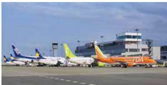
航空機とターミナル