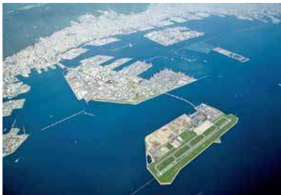
空からみた神戸空港

今後、航空需要の拡大に向けた取組みを進め、国内外からより多くの方を受け入れることで、神戸のまちの成長・発展のみならず、関西全体の発展に繋がることが期待されます。